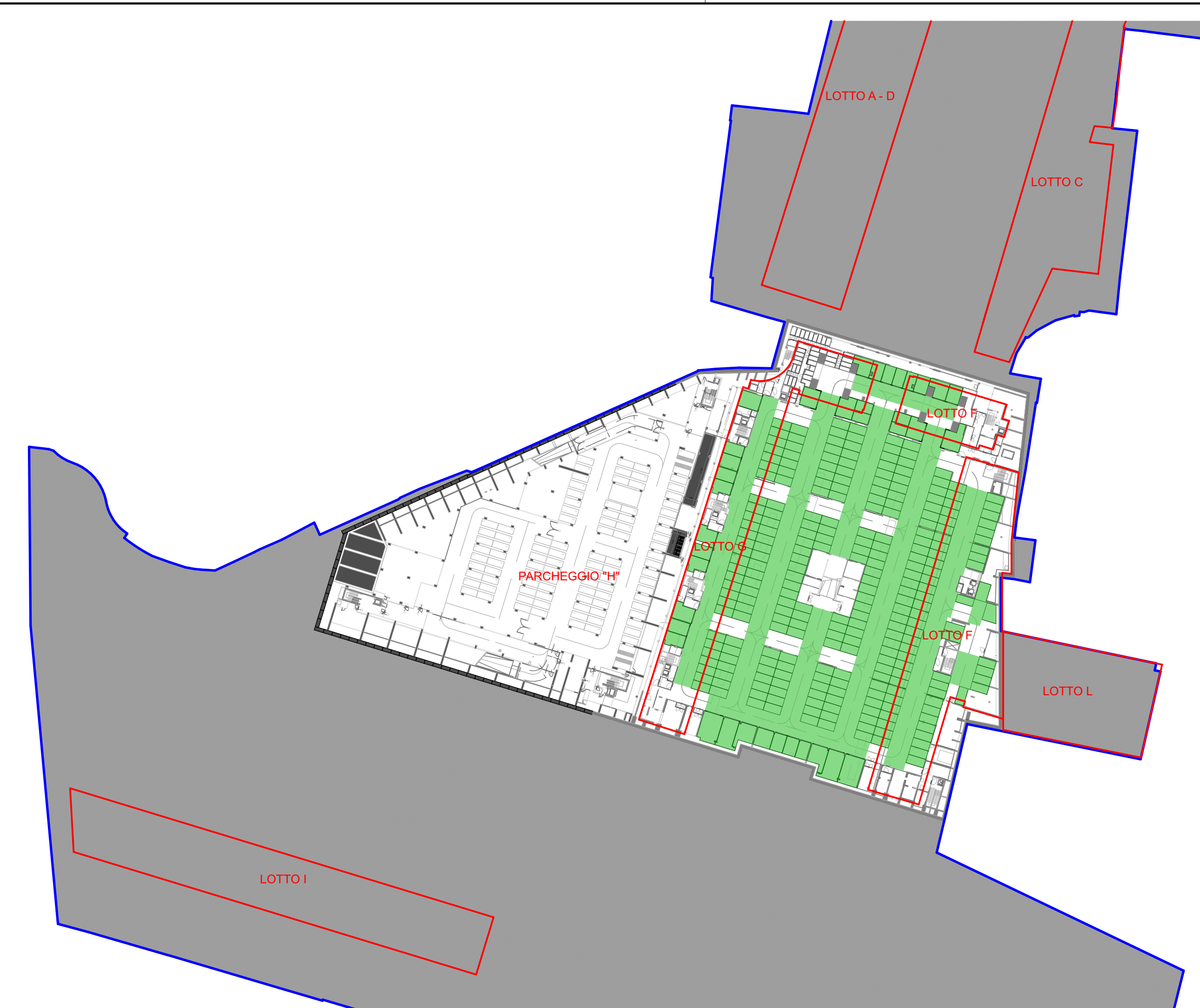
PARCHEGGI PERTINENZIALI LOTTI F-G - PIANTA PIANO INTERRATO - LIVELLO -2